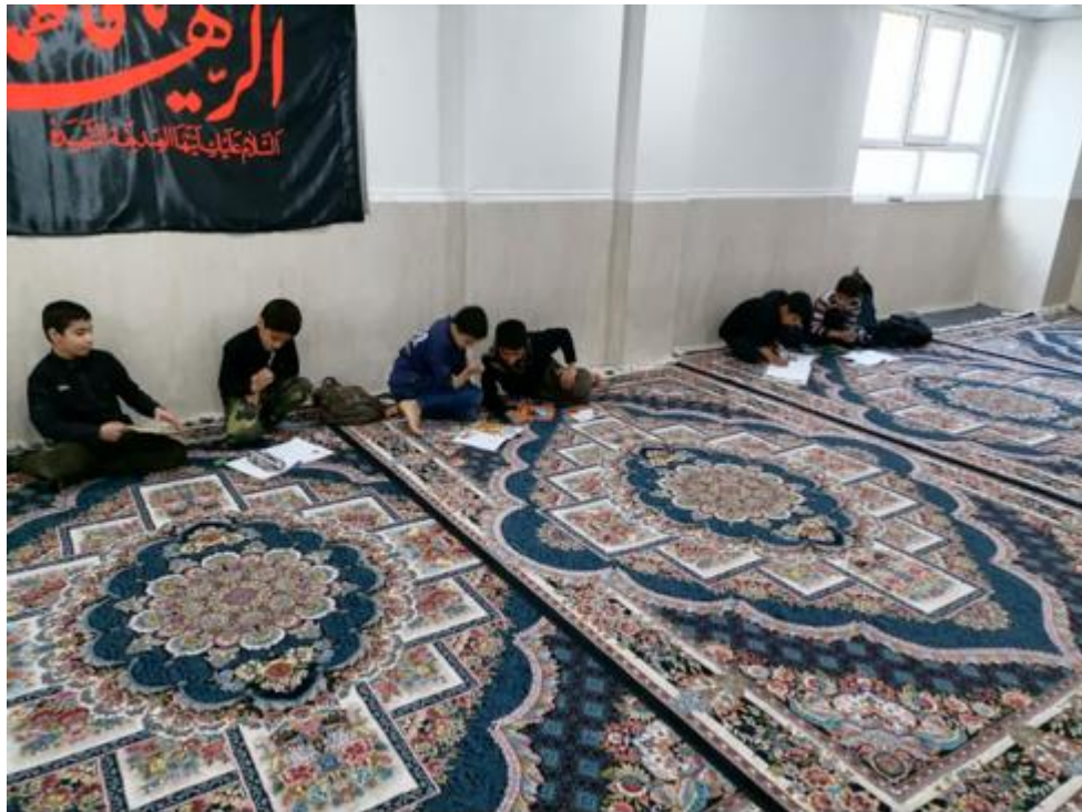
قرار دادن زمان مطالعه فردی و گروهی برای امتحانات