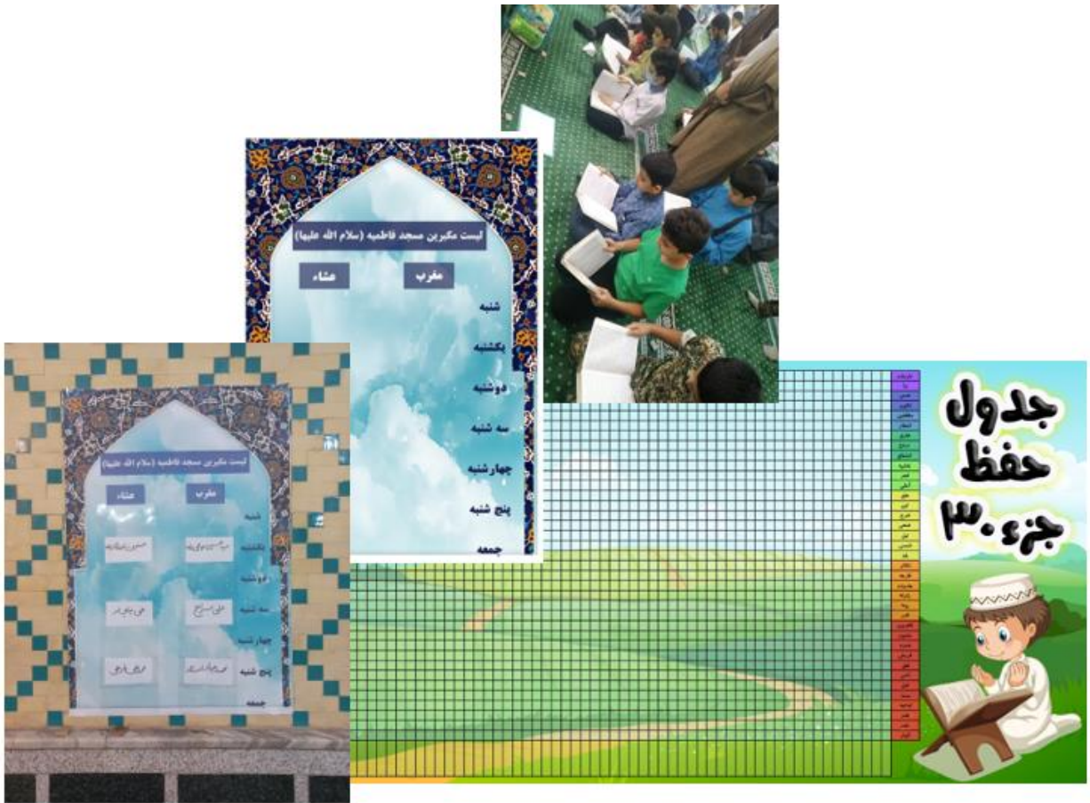
شرکت در قرائت قرآن شبانه مسجد و مکبری مسجد (تصویر فوق لیست مکبری مقطع ابتدایی می باشد)