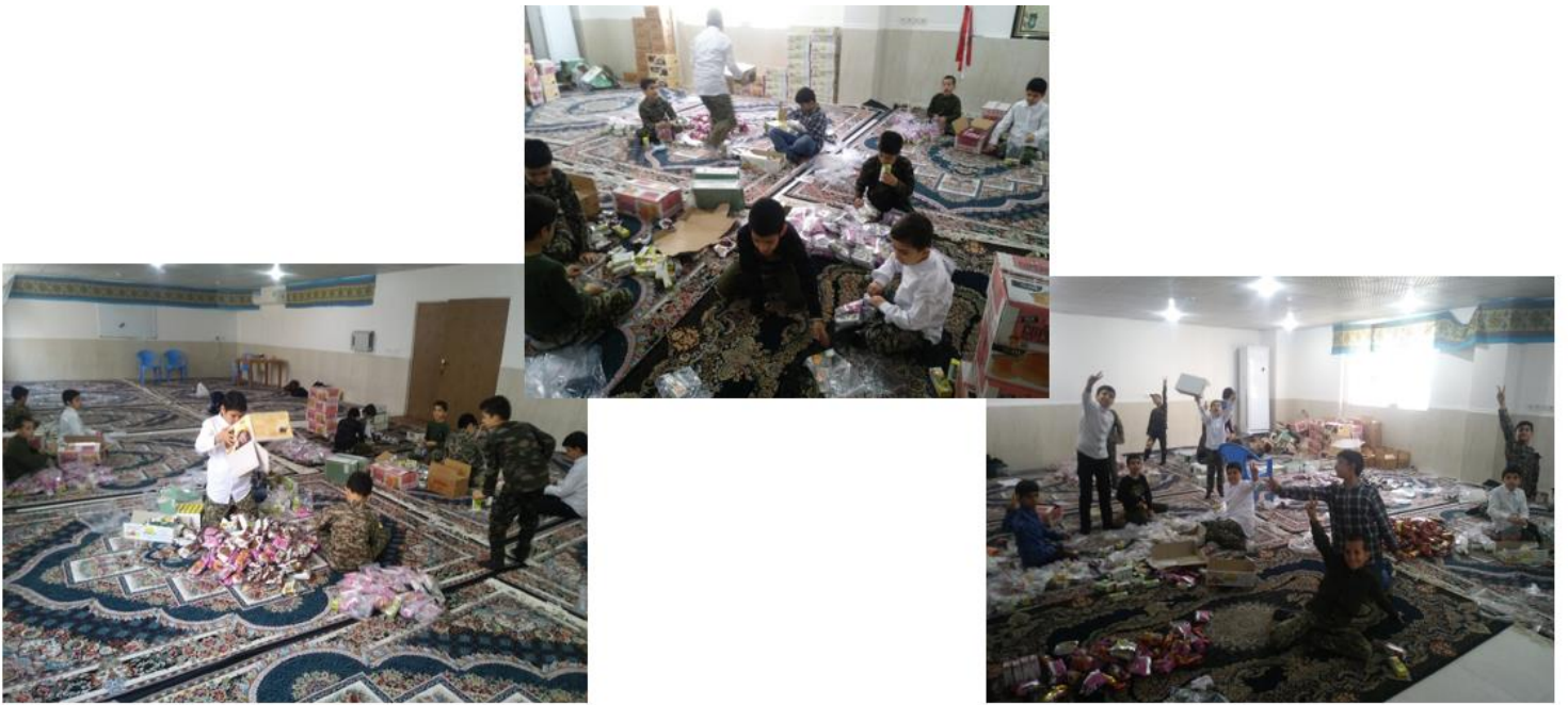
بسته بنده ۱۲۰۰ بسته پذیرایی جهت مراسم یادواره شهدا