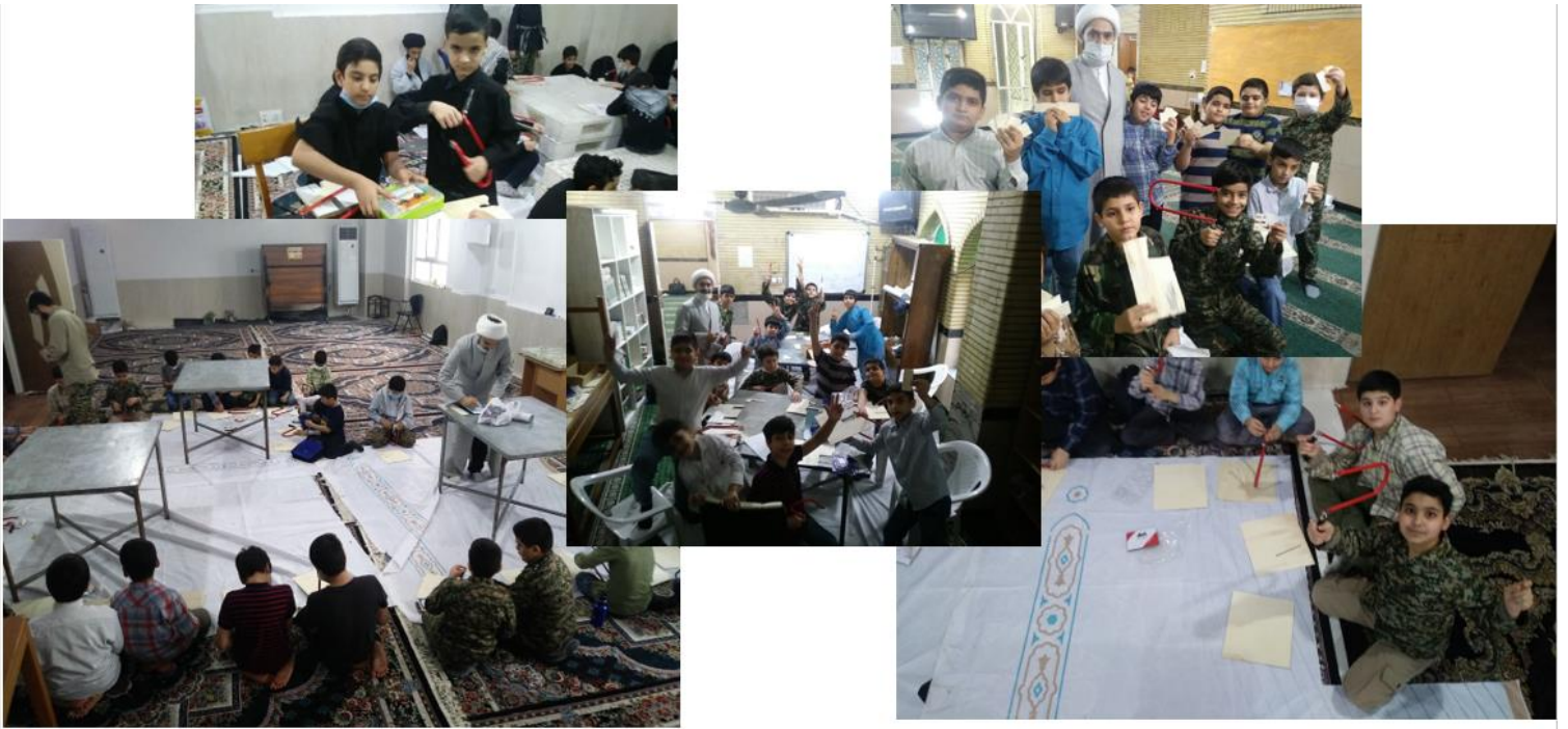
برگزاری کلاس های آموزش معرق کاری