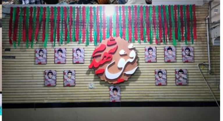
فضاسازی اتاق ها و مکان مراسمات و تابلو تبلیغات