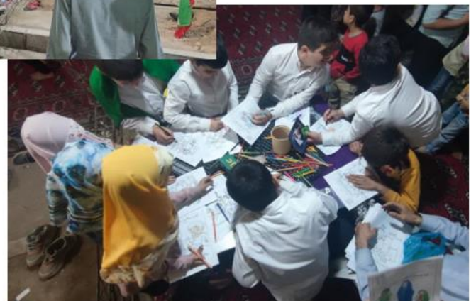
برپایی غرفه کودک و نوجوان در یادواره شهدای مسجد و برگزاری مسابقات دارت و نقاشی و حفظ قرآن