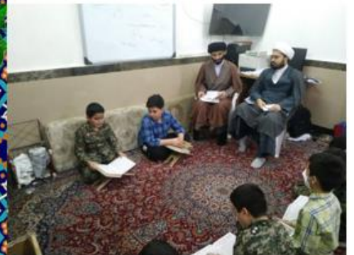
برگزاری مسابقات قرآنی مختلف در طول سال