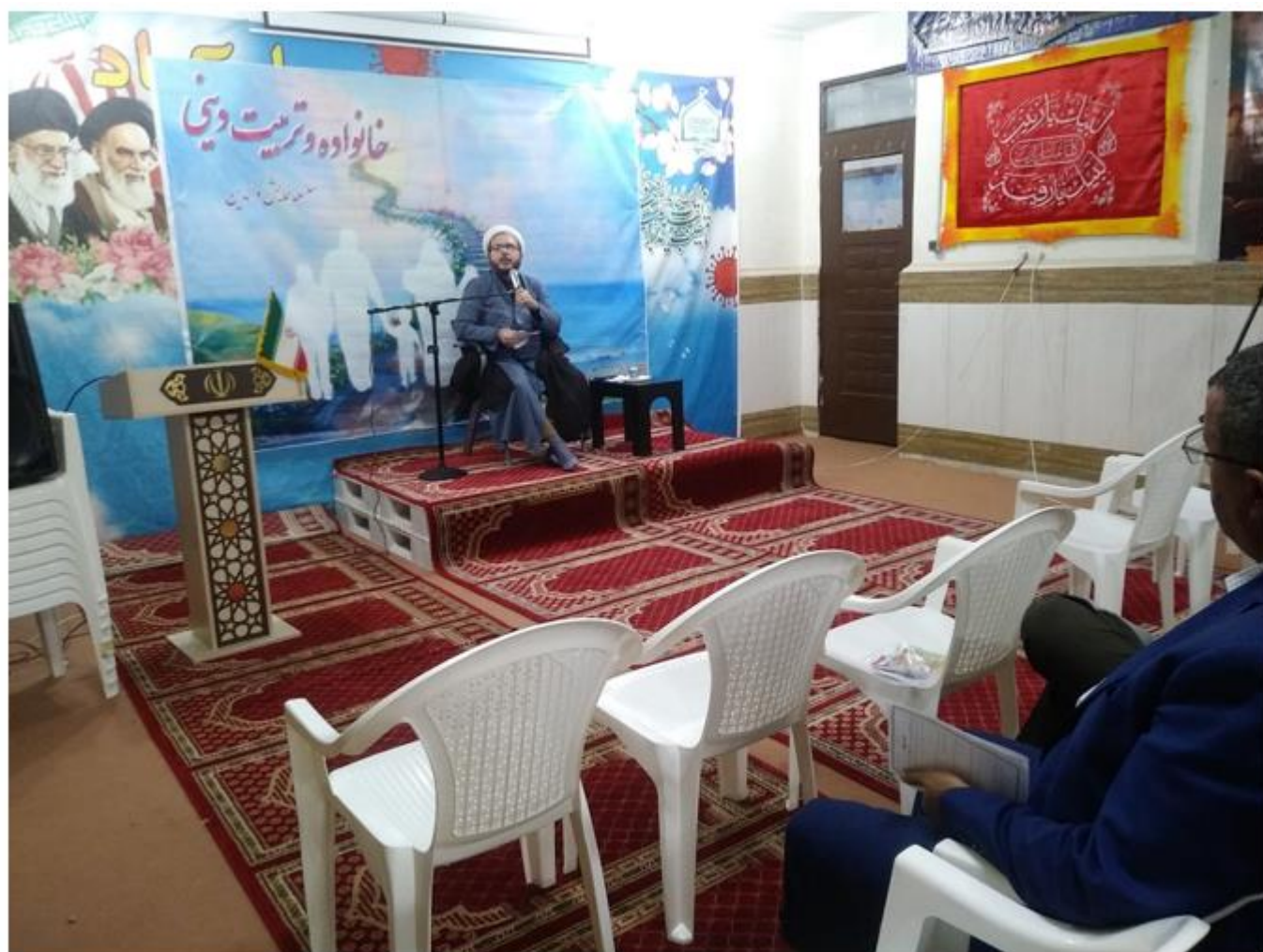
برگزاری کلاس های آموزش تربیت دینی مخصوص والدین