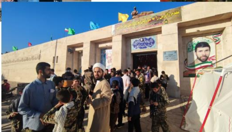
اردوهای راهیان نور