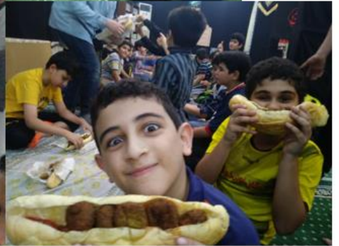
اردوهای درون شهری فرهنگی - تفریحی