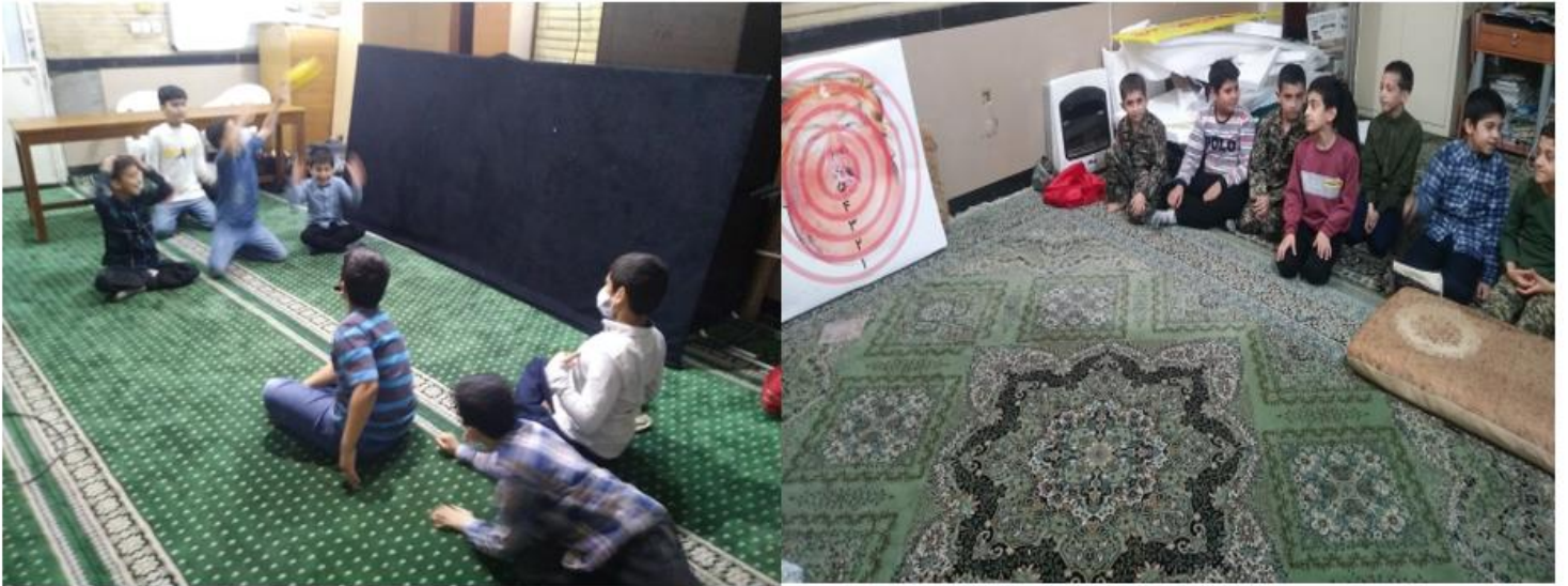
بازی های گروهی (هندبال نشسته - دارت و...)