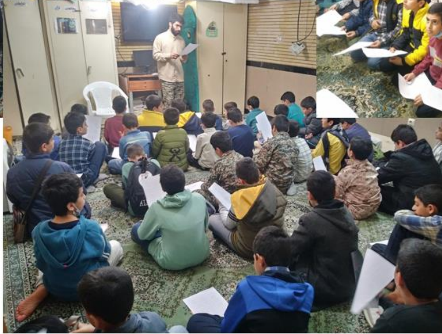
انتقال مفاهیم دینی و انقلابی از طریق سرود