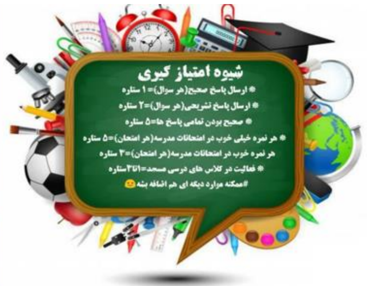
برگزاری مسابقات علمی مجازی