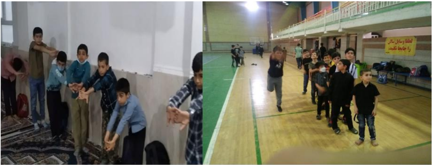
برنامه های ورزشی