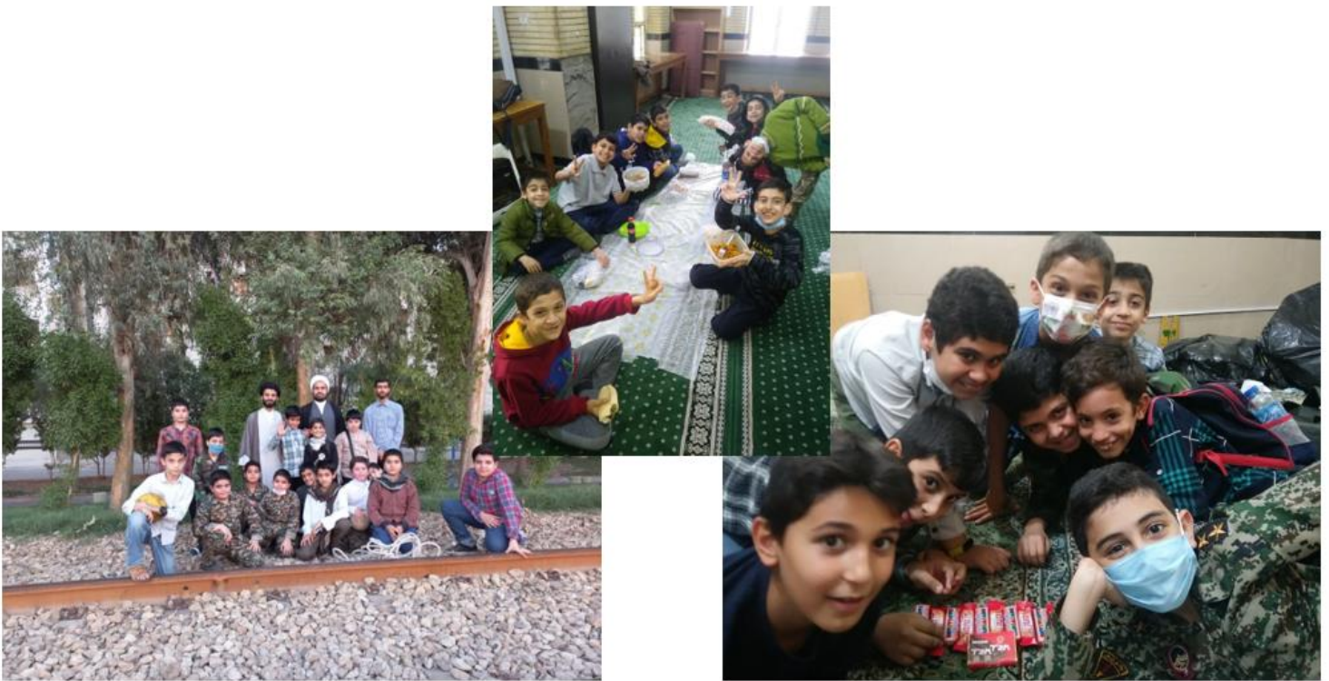
برنامه های صمیمی گروهی