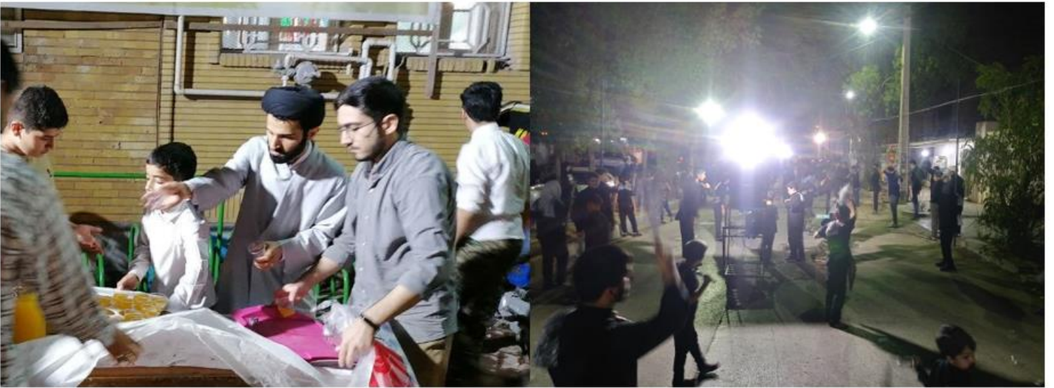
شرکت در مراسمات محرم و ایستگاه صلواتی اعیاد