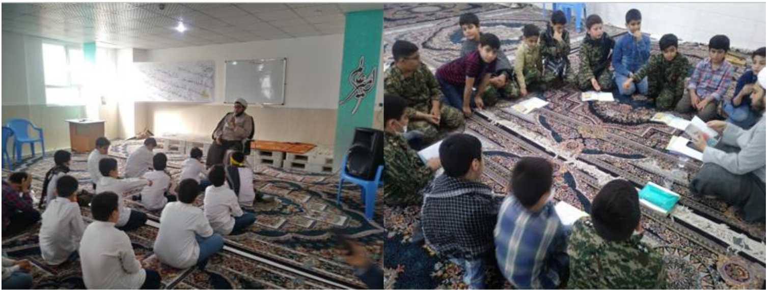
برگزاری کلاس با موضوعات عقایدی، آداب، احکام، قصه های قرآنی و اهل بیت و...