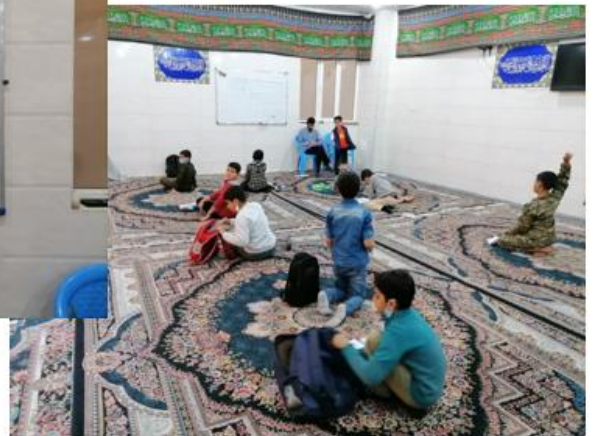
برگزاری کلاس های درسی مستمر در طول سال تحصیلی