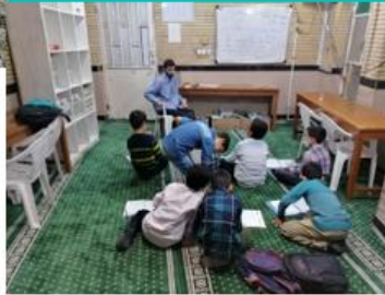
برگزاری کلاس های آموزش قرائت قرآن و حفظ موضوعی و مفاهیم قرآن و اعطای گواهی نامه