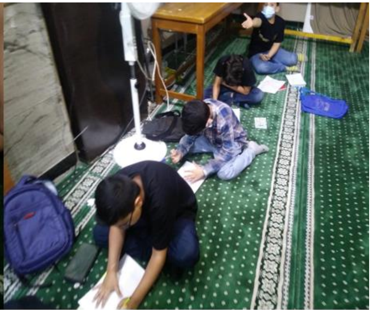
برگزاری مسابقات علمی